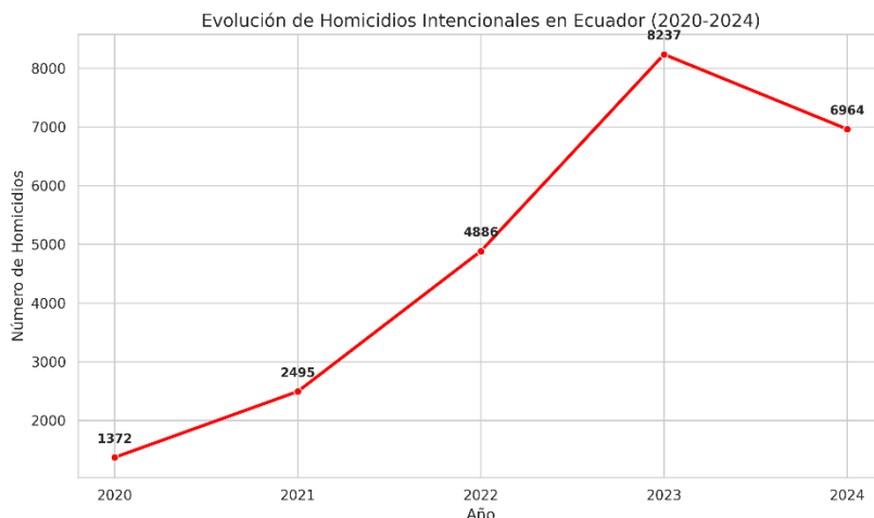
Figura 3. Evolución De Homicidios Por Cada 100.000 Habitantes

Por consiguiente, las Escuelas y Unidades educativas siendo el entorno principal del desarrollo de la vida escolar están siendo afectas por la creciente inseguridad, ya que a las afueras de este gran parte de los estudiantes entre ellos niños/niñas y adolescentes son testigo de múltiples hechos violentos, tal como lo reporta World Vision Ecuador en su informe anual un testigo NNA declaro que: “al llegar del colegio me senté a hacer tareas en el escritorio y escuché personas gritando e incluso algunos disparos...” (World Vision Ecuador & ChildFund, 2024). Para contrastando la información la Figura 3, muestra la evolución de los homicidios dentro de Ecuador, los cuales presentan una tendencia creciente, es de decir en el 2020 hubo 1.372 homicidios intencionales, es decir 7 por cada 100.000 habitantes, en el año 2023 se obtiene el pico más alto de 8.237 homicidios y en el 2024 6.964 homicidio lo que equivale a 38 por cada 100.000 habitantes (Gobierno de la Republica del Ecuador, 2024). Este crecimiento radical de la inseguridad dentro de Ecuador no solo ha colocado en riesgo la educación de los menores de edad obligándolos a abandonar el sistema educativo nacional, sino que al mismo tiempo pone en riesgo su existencia dada la cercanía que tienen los actos violentos a los planteles educativos.